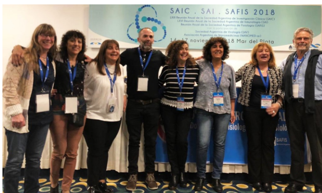
Comisión Educación SAFIS

La Comisión agradece a todos por su participación en el Encuentro.